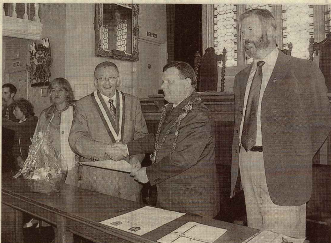
Au terme de la signature de la charte par les deux maires, en présence des deux présidents.

Si les élus ne sont restés que l'espace d'un week-end, les membres du jumelage continuèrent leur séjour par une visite à « Eden Project » à Saint Austell, dans le sud de la Cornouaille. En cinq minutes, ils se sont retrouvés en plein cœur de la forêt tropicale et de la végétation méditerranéenne, sous des bulles de plus de 50 mètres de hauteur... Place également au dîner offert par le comité anglais avec un repas à faire pâlir les détracteurs de la cuisine anglaise! Isabelle Eléouët et