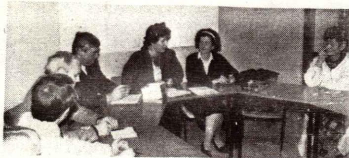
Au bureau, les responsables du comité de jumelage franco-anglais.