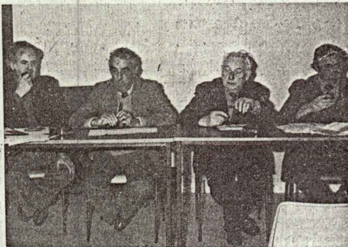
LANDIVISIAU. — La réunion était animée par le maire.

Des différentes questions posées par les participants, nous avons retenu que les échanges ne se feront pas seulement au niveau des enfants, mais que dans un premier temps c'est grâce à eux que se ferait le jumelage. Par ailleurs, si la municipalité landivisienne a déjà subventionné ce jumelage, il est bien évident qu'elle ne pourra le faire tout le temps et qu'il faudra que le comité s'assure différentes ressources.