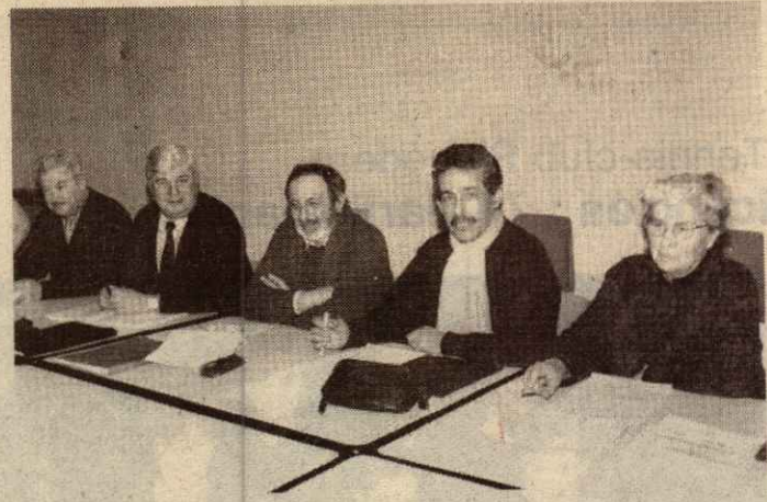
Le conseil d'administration a préparé avec soin les mois à venir.